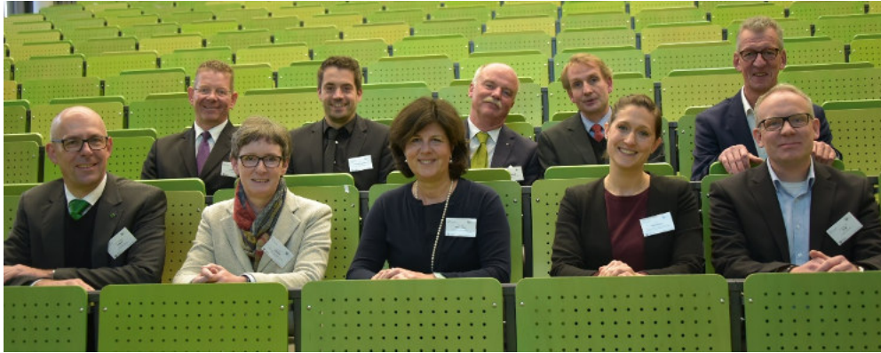
Projectadvance auf dem Hochschultag